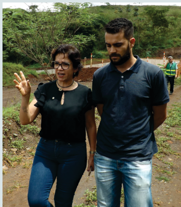
Visita a comunidade (Março - 2019)

Por causa das diversas demandas recebidas pelos seus Gabinetes em Brasília e o de Apoio no Vale do Aço, de pessoas reclamando sobre a deficiência nos serviços de distribuição de água e de tratamento de Esgoto, especificamente nos municípios de Timóteo,