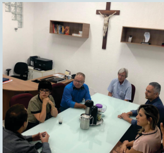
Visita ao Hospital Vital Brasil