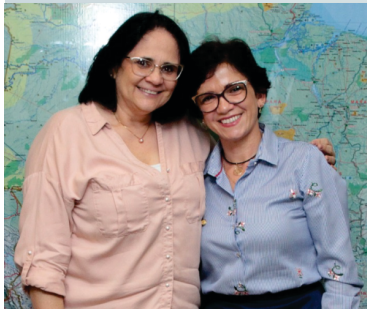
Ministra Damares Alves e Alê Silva

- Mediante uma lista recebida previamente no dia 20 de fevereiro, enviou o Ofício nº 03.2/2019 ao Deputado Federal, Diego Andrade, Coordenador da Bancada Mineira, com a indicação de cidades a serem contempladas com viaturas da PM. Por causa desta iniciativa, três viaturas OKm, Pálio Weekend, totalmente equipadas, foram entregues para a 12ª Região da PMMG, nas cidades de Santana do Paraíso, São Domingos do Prata e Inhapim. Este apoio da Deputada Federal Alê Silva à Segurança Pública gerou ainda no Estado de Minas Gerais, a entrega no total de 625 viaturas, contemplando mais de 450 municípios mineiros.