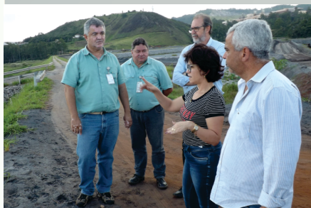
28 de Fevereiro, Barão de Cocais - MG, Mina Congo Soco

Devido a grave situação enfrentada pela população que vive próxima às barragens em Minas Gerais, a Deputada solicitou informações ao Ministério de Minas e Energia sobre as ações tomadas após o desastre da Barragem de Fundão num Distrito de Mariana. E ainda, sobre quais as medidas que estão sendo tomadas após o desabamento no início de 2019, da Barragem da Mina do Córrego do Feijão em Brumadinho. Requereu também que fosse indicada como membro Titular na Comissão Temporária Externa destinada a acompanhar todos os atos e fatos relevantes que desencadearam na tragédia ocorrida em Brumadinho. Sugeriu ainda a elaboração de um Projeto de Lei, que haverá de ser de iniciativa do Poder Executivo, que autorize a criação de uma autarquia com o objetivo de gerir, monitorar e fiscalizar as barragens existentes no País.