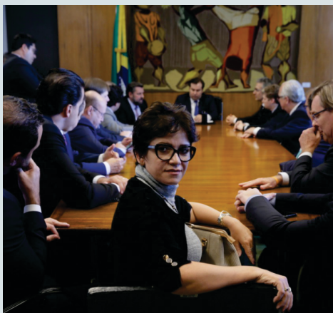
Reunião da Bancada Mineira com o Governador Zema