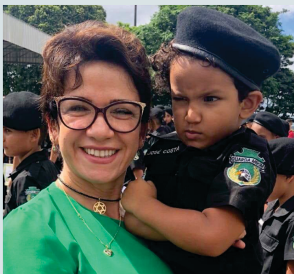
Visita a Guarda Mirim no 14º batalhão de Ipatinga