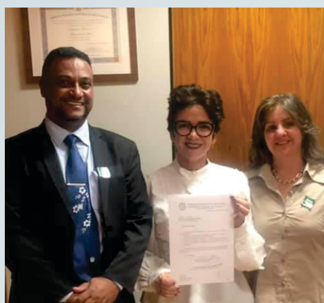
Reunião no Gabinete em Brasília