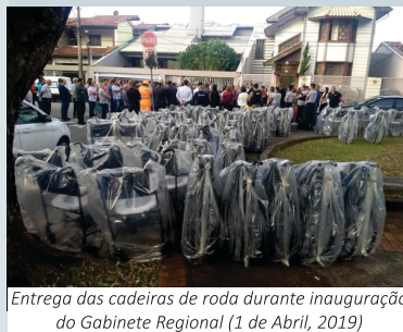
Entrega das cadeiras de roda durante inauguração do Gabinete Regional (1 de Abril, 2019)

Recurso do Auxílio Mudança ajuda instituições