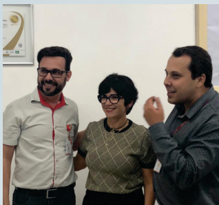
Momento registrado durante conversa com funcionários do Hospital Vital Brasil