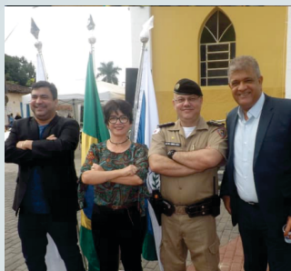
Durante a Cerimônia de entrega das viaturas na cidade de Santana do Paraíso