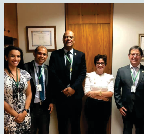
Reunião no Gabinete em Brasília