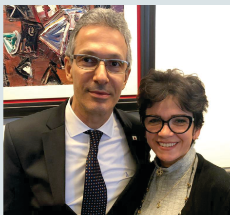
Foto após reunião da Bancada Mineira com o Governador Zema