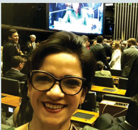
Alê Silva durante o primeiro dia no congresso como Deputada Federal