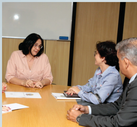
Reunião com a Ministra Damares