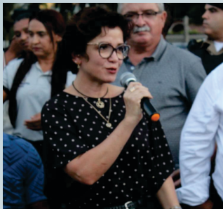
Inauguração do Gabinete Regional e entrega das cadeiras de roda