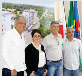
Foto durante reunião na AAPI