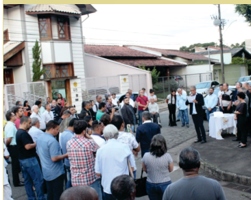
Inauguração do Gabinete de Apoio (1 de Abril, 2019)

A Parlamentar inaugurou em 01 de abril p.p. o seu Gabinete de Apoio, localizado no bairro Cariru, rua Panamá n. 57, em Ipatinga, que apesar de já estar em pleno funcionamento desde o último dia 05 de fevereiro, não havia sido formalmente apresentado à comunidade. Diversas autoridades estiveram presentes, dentre elas: políticas, da sociedade civil e das Polícias Militar e Civil.