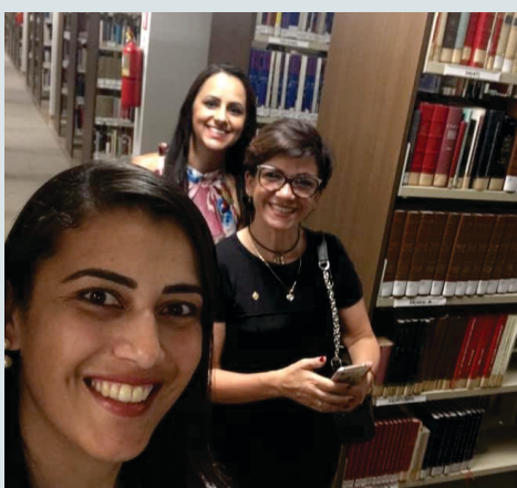
Conhecendo a magnífica Biblioteca da Câmara