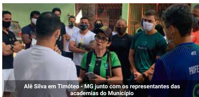
Alê Silva em Timóteo - MG junto com os representantes das academias do Município

Ciente de que a prática de atividades físicas não é uma questão de vaidade, mas sim de saúde e que em tempos de pandemia é primordial que o cidadão se cuide, pois um físico bem preparado tem maiores condições de vencer a qualquer vírus, a Deputada Federal Alê Silva participou de vários manifestos e levantes pela reabertura de academias de ginástica, destacando-se os movimentos que ocorreram em Coronel Fabriciano, Timóteo e Ipatinga entre os dias 07 e 10 de maio. Quando foi no dia 11 de Maio, ouvindo o clamor do segmento e entendendo a sua essencialidade, o nosso Presidente Jair Bolsonaro fez publicar o Decreto nº. 10.344/20 permitindo a reabertura, não só das academias, mas como também, dos salões de beleza e barbearias por todo o País.