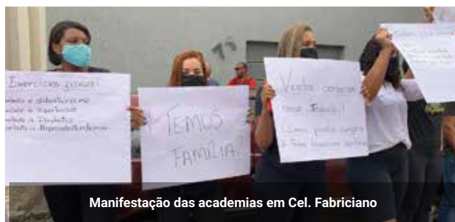
Manifestação das academias em Cel. Fabriciano