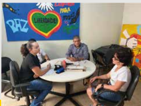
Visita ao CSE - Centro Sócio Educativo de Ipatinga, em janeiro, para conhecer as instalações. A Dep. indicou R$ 600.000,00 (seiscentos mil reais), cujo valor também já está autorizado pelo MJSP.